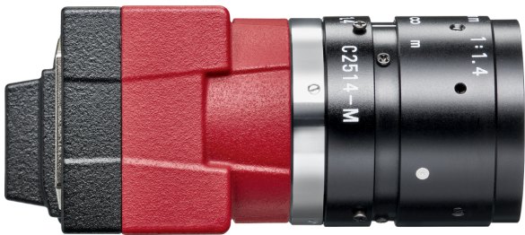
Model without hardware options